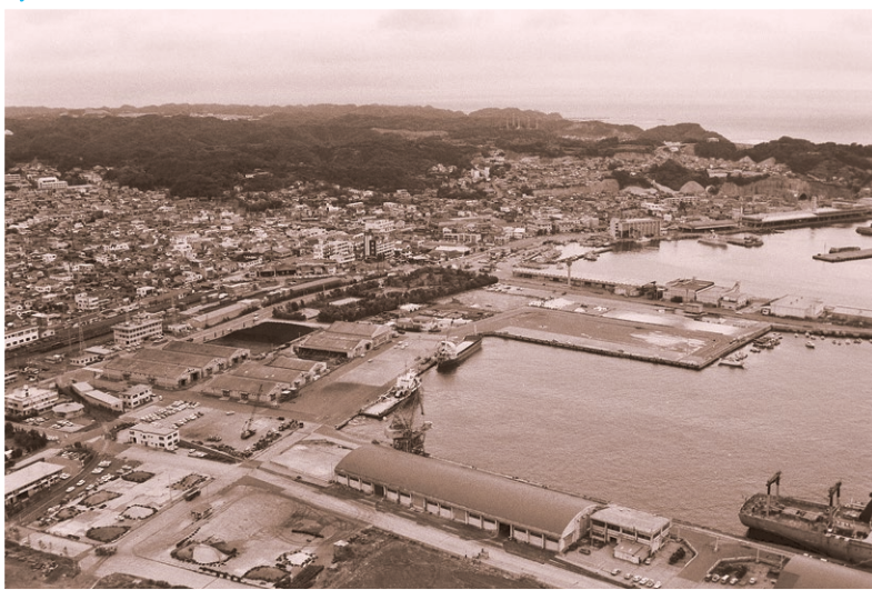
小名浜港2号、1号埠頭を西側から見る 1987(昭和62)年8月

「あいきょうさい」が会員の皆さまをはじめ、広く県民の皆さまに季節感あふれる話題や生活に役立つ情報、さらには主催する各種カルチャー教室や無料法律相談会などの日程をお知らせする情報紙で、年4回(春・夏・秋・冬)発行しています。