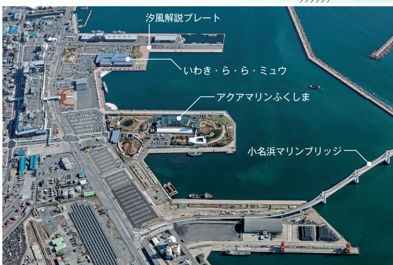
現在の小名浜港 2018(平成30)年撮影